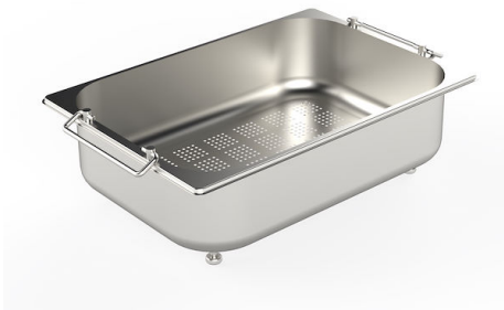
CUVETTE PERFOREE INOX A154 F00

* uniquement en combinaison avec l'accessoire A644 F04