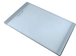
PLANCHE DE DECOUPE CRYSTAL 23x41 CM A631 C00

* uniquement en combinaison avec l'accessoire A644 F04